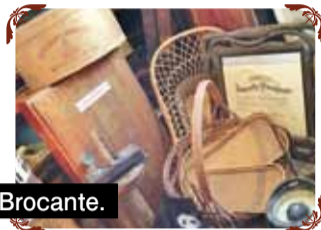
Brocante. 古道具、木製品、アンティーク雑貨、ジャンク、アイアン、グリーン、布製品