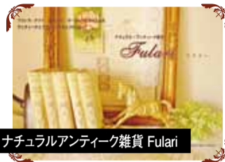
ナチュラルアンティーク雑貨 Fulari ヨーロッパを中心としたアンティーク・プロカントの雑貨、アンティークを使ったアクセサリ雑貨