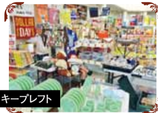
キープレフト アメリカンアンティーク雑貨