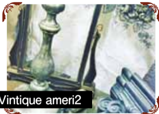
Vintage ameri2 西洋アンティーク雑貨