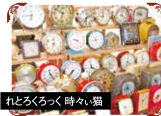
れとろくろっく 時々猫 数十年から百年以上も前に作られた古い機械式の置時計・柱時計