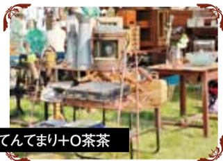
てんでまり+O茶茶 アンティーク家具、古道具、ガーデニング用品

全国で人気のアンティーク家具・雑貨店が集まります！ ほとんどの商品が1点ものばかり。他とも被らず愛着が湧くこと必須です。 まるでヨーロッパの蚤の市やアンティークショップにいるような気分になります。プチ海外旅行へどうぞ！