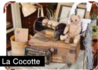
La Cocotte 主にフランスより直輸入した1900年～1940年ごろのプロカント・アンティーク雑貨