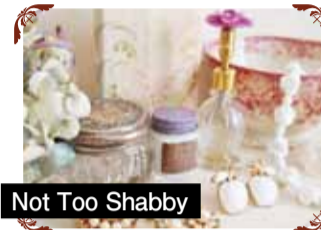
Not Too Shabby ヴィンテージコスチュームジュエリーやアンティーク・ヴィンテージの雑貨