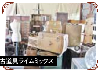
古道具ライムミックス 明治・大正・昭和の古道具、古家具、古雑貨、アンティーク食器等