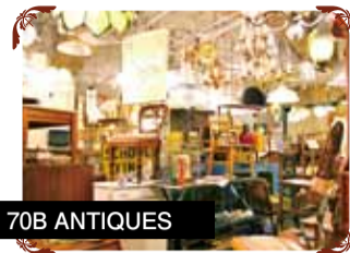
70B ANTIQUES ヨーロッパやアメリカで買い付けたアンティーク家具・雑貨