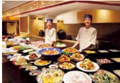
鳴門鯛を三刀流で味わう造り、寿司、揚げたて天ぷら、炭火焼からデザートまで90種類以上が揃う割烹バイキング阿波三味。その他、豪快な炭火焼コース、しっとり和会席、気取らずにお箸でいただけるフレンチ懐石から夕食をチョイスできる。