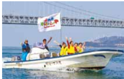
鳴門の潮風に吹かれて、気分爽快なクルージングが楽しめる