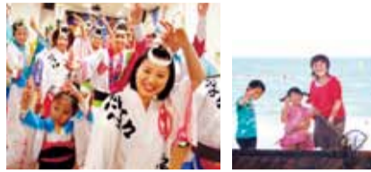
人気の阿波踊りライブ 鳴門鯛の釣り堀体験