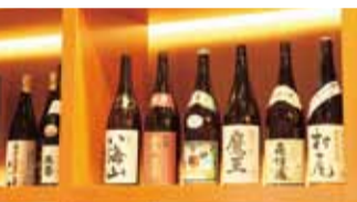
鹿兒島直送の焼酎や全国の地酒も豊富に揃う。