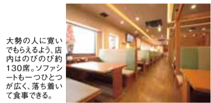
大勢の人に寛いでいただけるよう、店内はのびのび約130席。ソファシートも一つひとつが広く、落ち着いて食事できる。