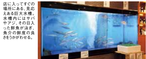
店に入ってすぐの場所にある、見応えある巨大水槽。水槽内にはサバやアジ、その日入った鮮魚が泳ぎ、魚介の鮮度の良さをうかがわせる。

ゴールデンウィークは美味しい食事を楽しみながら近場でのんびり。そんなご予約の皆さん、広々とした空間で新鮮なお魚料理はいかがですか?50代からが、人生の「グッドシーズン」。さあ輝く毎日を始めましょう。