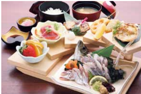
あじ姿造り定食 1,580円 あじ姿造り、海鮮ミニグラタン、串揚げタルタルソース添え、旬の魚の塩焼き、小鉢、ご飯、味噌汁、香の物、デザート