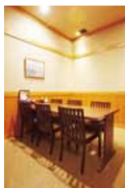
ゆったり広い個室も5部屋用意。引き戸付きの完全個室のため、ファミリーに人気。最大20名用にもなる。

■取材協力 大漁市場 こんぴら丸 箕面店 (こんぴらまる) 箕面市船場東3-13-11 ビーバーワールド箕面船場店1F 営/11時半~15時半、17~23時 無休 全席禁煙(喫煙室あり) ☎072-727-1137