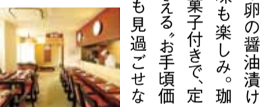
串焼きや卵の醤油漬けなど珍珠も楽しみ。珈琲とお茶菓子付きで、定期的に通える、お手頃価格なのも見逃ごせない。美容と健康のために!

丸なべ 和料理 明石倶楽部 (あかしくらぶ) 箕面市白鳥2-22-24 予約優先 営/11時半~15時 不定休 ※夜は当面、日曜祝日のみ営業 (17時半~22時) 駐車場5台あり ※10歳以下のお子様のお入り不可 ☎090-3490-7739 (予約専用) ☎072-723-7739