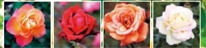
アンネのバラ ノリータ テディベア ピース プリンセスミチコ ミスカナダ 高雄 聖火

問合せ先 06-6877-7387 (総合案内所) EXPOCITYに関するお問合せは06-6170-5590(10:00~18:00) 周辺道路及び駐車場の混雑が予測されます。公共交通機関でのご来園にご協力お願いいたします。