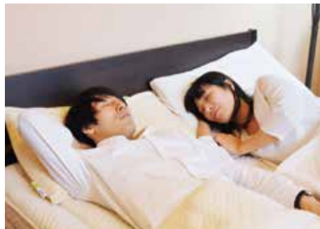
寝心地がよいと、立ち姿勢のような理想の寝姿勢をキープできるようになるそう。

た寝具は人それぞれ。どれを選べばいいかわからないときは、プロに相談を。「寝具は体の歴史をつくるもの。実際に寝てみるのをお勧めします」。