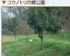
▼コウノトリの郷公園

山陰海岸ジオパーク 世界ジオパークネットワーク(ユネスコ支援)により認定された自然公園。 事務局 ☎0796-26-3783 http://sanin-geo.jp 湯村温泉 湯村温泉観光協会 ☎0796-92-2000 http://www.yumura.gr.jp