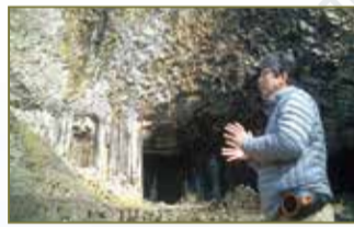
▲玄武洞ではガイドさんの説明がわかりやすい

城崎温泉に近いところにある玄武洞。大昔の火山活動でできた岩に目を見張る。規則正しく柱のように並んでいる。160万年前にマグマが冷えてできた、といわれても信じられない。圧倒的な量と美しさにおそれ入りましたという感じだ。