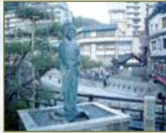
▲湯村温泉の夢千代像

神鍋高原を横切るようにドライブして、湯村温泉へ。いわゆる美肌系の重曹泉で、源泉は98度と高温。ゆでたまご作り体験がおもしろい。その川向いには、吉永小百合のドラマ「夢千代日記」で有名になった記念碑がある。