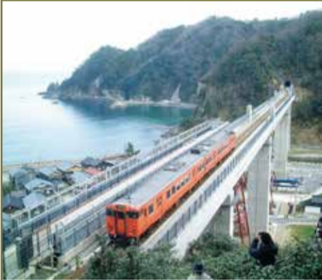
▲余部橋梁。余部駅には展望所があり、旧鉄橋も一部残されている

「山陰海岸ジオパーク120kmウォーク」開催中 京丹後市、豊岡市、香美町、新温泉町、岩美町、鳥取市の山陰海岸ジオパークエリア内で、山陰海岸ジオパーク120kmウォーク実行委員会が主催・認定するウォーキングイベント「山陰海岸ジオパーク120kmウォーク」。広大で豊かな自然と風土を体感してもらうことを目的に、平成30年2月4日まで3年間に渡って実施中。 「山陰海岸ジオパーク120kmウォークin名勝香住海岸」 5/22(日)9時、しおかぜ香苑(兵庫県美都郡香美町香住区香住)集合。三田浜海水浴場まで3.5kmを往復する。大人(中学生以上)1,000円、子ども(小学生)500円、小学生未満は無料。 5/16(月)までに要申込・先着120名。地引き網体験やバーベキュー等も。申込・問合せ:香美町観光商工課 ☎0796-36-3355 ●詳細はwebにて http://www.town.mikata-kami.lg.jp/