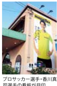
プロサッカー選手・香川真司選手の看板が目印。

睡眠を見直して、朝から体も心も軽やかに感動の寝心地を手に入れよう マニフレックス