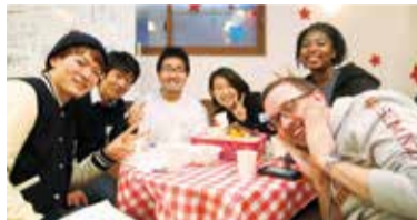
異文化交流イベントも多数。4/29(金祝)は香榎園浜でのBBQ「春フェス」、5/15(日)はポッドラックランチパーティ、5/29(日)にはイングリッシュパーティを開催。

特典 「シティライフを見た」で、今学期(5~9月の5ヶ月分)の授業料... 3,000円OFF (5月中旬に新規入会の方)