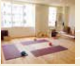
新しくキレイで、素材の木製のスタジオはリラックス効果を高めてくれる。

ピラティス 子連れOK! 親子ピラティスグループレッスン/ 日 程: 毎週火・金 10時半~11時半 約60分 各回定員: 3組まで 参加費: 2,000円 ※詳細はスタジオに問合せを