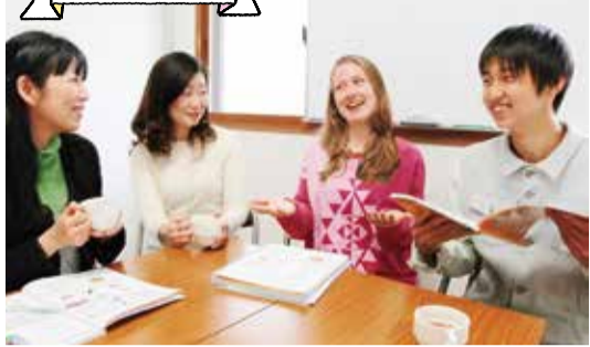
レッスンは身近な話題を英語で話すフリートークからはじまる。「完璧でなくてOK」なので、緊張せずどんどん話せるそう! 少数制レッスンだから発言の機会も多い。