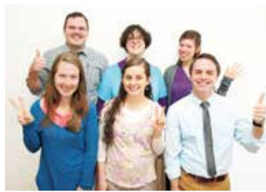
気さくでレッスンが丁寧と生徒から支持される先生たち。間違っても、ゆっくり正しい表現を教えてくれるので初心者も安心して学べる。

新生活が落ち着いてきた今こそ英会話をはじめめるチャンス! 同スクールは、英語力上達には楽しむことが一番として「Enjoy English!」をモットーとしている。だから、レッスンは笑い声が絶えないほどアットホームな雰囲気。楽しいからこそ続けられ、長続きできるからこそ「生きた英語」が自然に身につくそう。クラス数は100近くあり、超初心者から上級者までレベルに合わせて無理なく習える。また、休んでも授業の振り替えは電話1本でOK、90分レッスンなのに料金は50分レッスン並と通いやすいのもポイント。「夏の海外旅行を考えている」「仕事で必要になってきた」「ずっと英会話が気になっていた」という人は、気軽に無料体験へ!