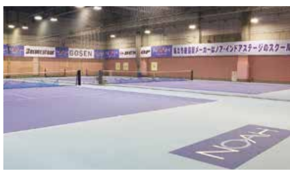
天候・季節に影響されず、花粉や紫外線の心配もない屋内コートが特徴。ほか、施設内はシャワールームが完備され、くつろげるロビーでは生徒とスタッフの笑い声がふれている。