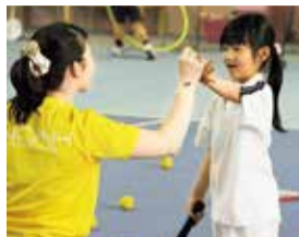
親子と一緒にプレイできる「親子クラス」や、4才からのジュニアクラスと同じ時間にプレイできる、お得な「ママさんクラス」も好評。