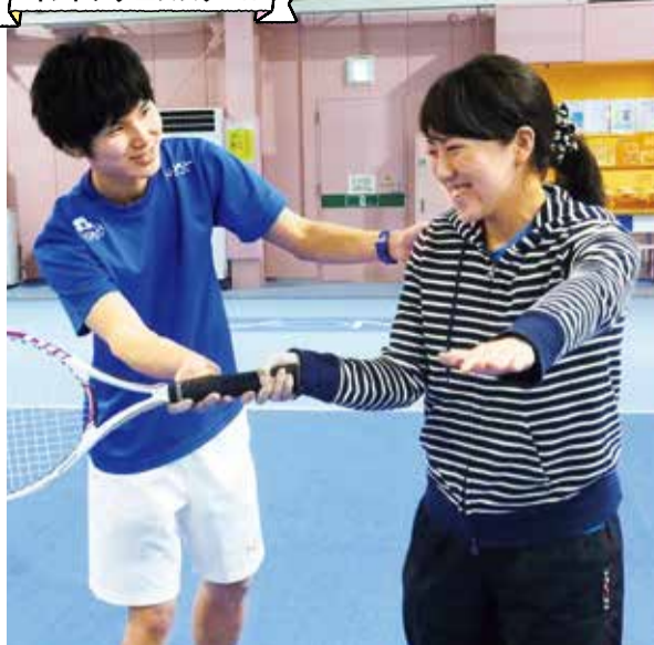
「ラケットを握ったことがない」「スポーツが苦手」という人でも、コーチが丁寧・親切に教えてくれるから大丈夫。