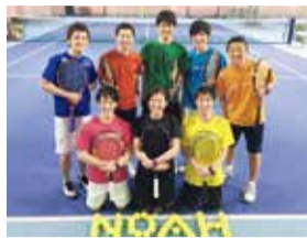
指導経験豊富なコーチ陣と、親しみやすいフロントスタッフが心身両面でサポートしてくれる。テニス業界ではじめて関西経営品質賞を受賞。