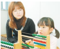
そろばんを使ってかずあそび!

子どもたちは、右脳が優位に働く状態で生まれてくる。この時期にこそ、学習に役立つ「右脳の能力」を育ててあげると、その後の学習がとてつもなく楽しくなる。また七田式教育は引き出した右脳の能力を、表現に導くことで左脳の能力につながる「全脳教育」を実践している。