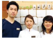
親身な女性鍼灸師も常駐。初めてでも安心して頼れる。完全個室だから子連れOK。