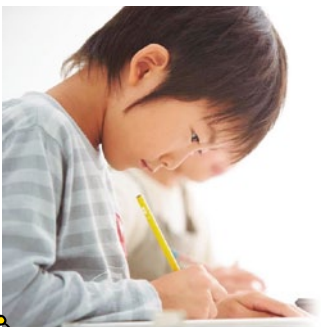
自分の頭で考える力が身につくので、発展・活用問題にも対応できる学力が養える。

教科によってちょっと苦手がある子も、学年より先取りしたい子にもおすすめしたいのが学研教室。例えば、算数教材では学校で習う単元全てを学習するので、苦手な分野が明確になり、克服できるようになる。週に2回、短時間集中の学習方法なので他の習い事との両立がしやすく、勉強習慣が身につくのも嬉しいポイント。無料体験を随時受付しているので、まずは一度体験してみてください。