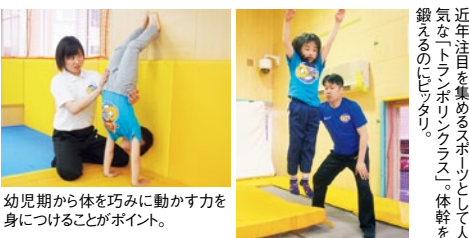
幼児期から体を巧みに動かす力を身につけることがポイント。

運動の習い事の低年齢化が進む要因として、幼少期に様々な運動経験しておくこと脳や運動神経の発達に繋がることが認知されてきた昨今。アップ教育企画が運営する同スクールでは、「トランポリンクラス」や「体操クラス」など、幼児から通えるレッスンメニューが多数用意されている。その丁寧な指導には好評で、小さなうちから体を巧みに動かす「調整力」や「バランス・リズム感」「体幹の力」を身に付ける要素が満載だそう。今回は、平日に子どもを通わせることができない人や、一度に複数のクラスを通わせたい保護者の要望に応え、日曜日にトランポリンと体操を同時に習える特別クラスを用意。レッスン時間は通常60分(平日)のところ、100分(小学生クラスの場合)とたっぷりあるので成長が期待できる。明るい声がいっぱい飛び交うレッスンを一度体験してみてください!