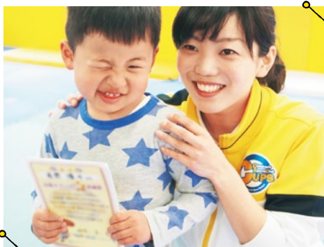
子どもへの運動指導を専門にし、楽しんでもらうこと、成長を真剣に考えるスタッフが揃う。目標を達成した時は子どものやる気がより一層高まるチャンス!

運動の習い事の低年齢化が進む要因として、幼少期に様々な運動経験しておくこと脳や運動神経の発達に繋がることが認知されてきた昨今。アップ教育企画が運営する同スクールでは、「トランポリンクラス」や「体操クラス」など、幼児から通えるレッスンメニューが多数用意されている。その丁寧な指導には好評で、小さなうちから体を巧みに動かす「調整力」や「バランス・リズム感」「体幹の力」を身に付ける要素が満載だそう。今回は、平日に子どもを通わせることができない人や、一度に複数のクラスを通わせたい保護者の要望に応え、日曜日にトランポリンと体操を同時に習える特別クラスを用意。レッスン時間は通常60分(平日)のところ、100分(小学生クラスの場合)とたっぷりあるので成長が期待できる。明るい声がいっぱい飛び交うレッスンを一度体験してみてください!