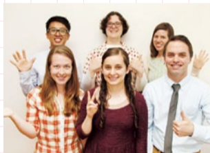
講師陣は熱心でフレンドリーな上、礼儀正しく、多くの生徒から慕われている。