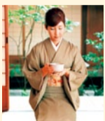
授業では和のマナーも学べる

※先着順受付・要ご予約 日程:6/5(日)~7/5(火) 各日①10時半 ②14時半(土曜は13時半) ③18時半(土曜は15時半) ★7月生初級コースは 7/19(火)スタート 梅田校、なんば校、 天王寺校でも受付中! 詳細HPへ