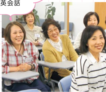
アットホームな雰囲気のある教室。