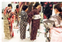
授業で使う着物や帯は無料レンタルできるので、手ぶらでOK!