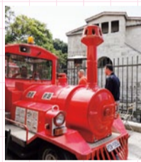
Where can I get a ticket? (切符はどこで買えますか?)