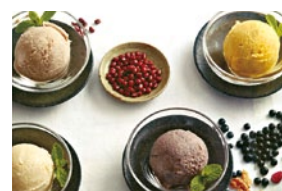
砂糖、卵、乳製品不使用のソイアイス あずき(左上)・白大豆(左下)・黒豆(右下)・かぼちゃ(右上) ※予約販売のみ。※商品はお届け先へ直送。

現在、日本でごくわずかししか流通していない国産有機大豆。今城さんのアイスは、この希少な国産有機大豆を使って、自社工場で生産から加工まで独自の製法でつくられている。大豆独特のえぐみを取り、余計なものを何も加えず豆乳をつくる。その豆乳から作ったアイスはクセがなく、なめらかで後味もすっきり。大豆の旨味が詰まった至極の逸品だ。