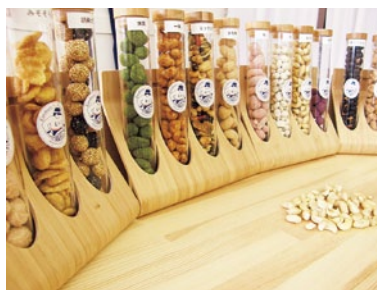
カラフルで可愛いナッツはプレゼントにも最適。扱うテキストは16種類。

「シティライフを見た」で まぜそばの麺を大盛に変 更またはトッピングの味玉or 九条ねぎorチーズ 無料 (6月末まで・1人1回限り)