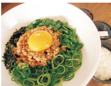
辛口濃厚台湾まぜそば(追い飯付)780円