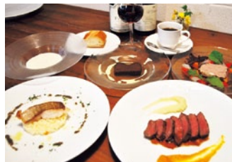
写真の「バゲットステーキ」や「本日の魚料理」からメイン料理を選ぶランチコース(1,500円)は、前菜・スープ・デザートに至るまでフランス仕込みの技が光る。