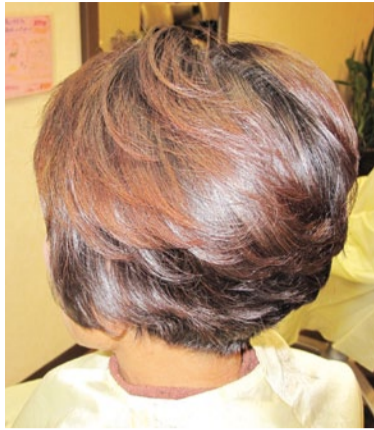
自然派の厳選された商材を使うからこそ、60代でもこのツヤ!