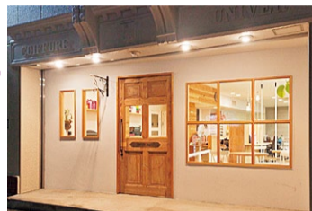
根元のベタンコが気になる人はオーガニックパーマを試してみてください!

初夏の紫外線ダメージや、梅雨時の湿気で髪のうねりや広がり。髪型やヘアケアに関するストレスを払拭してくれる地域の頼れるサロンを紹介します。