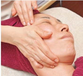
リンパドレナージュや、ツボ刺激・骨盤矯正を取り入れた手技はイタ気持ちよい。

特典「シティライフを見た」で ●「これだけで身体が変わる」と話題のカウンセリング・身体バランスチェック(4,200円)が 無料 ●下記のメニューはいつでもカウンセリング、身体バランスチェック付き 【メディセル】選べるセルライト除去(90分) 3,900円 【全身美容整体】(120分)..... 5,000円 (6月末まで 要予約 新規のみ)