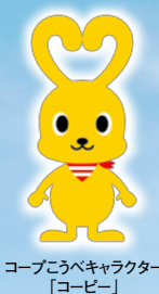
コープこうべキャラクター「コービー」