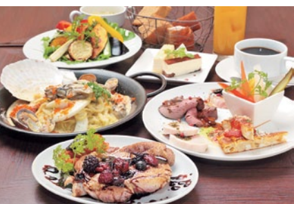
前菜3種、サラダ、スープ、お肉メイン、パスタ、デザート、パン&ソフトドリンク食べ飲み放題のランチ女子会プラン! ※内容は相談可