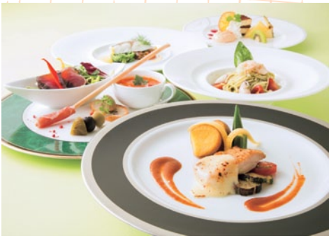
見た目の美しさはもちろんのこと旬な食材などシェフのこだわりが見られる。ホテルでしか味わえないおいしい料理にぜひ舌鼓を。