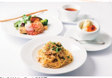
ランチ(A)コース 1,500円 前菜ワンプレート盛り合わせ/選べるパスタ/パン/デザート/食後の飲み物