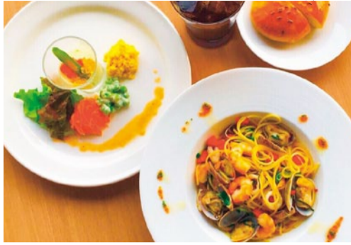
本日のパスタランチ 1,080円 ※3種類のソースから選べる。写真はシーフードのペペロンチーノ

トマト、クリーム、ペペロンチーノの3種のソースから選べるパスタランチが人気。具材は日替わりで楽しめる。その他、パンケーキランチもあり、チーズハンバーグは系列焼肉店の本格黒毛和牛を使用。際立つ美味しさだ。この時期は風が心地良いテラス席がおすすめ。テラス席はペット同伴OK!