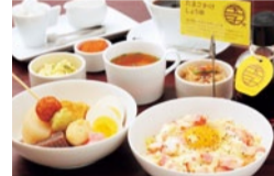
あっさり京風だしの自家製ODENランチ (1,100円) ※選べるごはん 10穀米、TKG、 ペーコンチーズTKG+100円

特典 「シティライフを見た」と 1品以上注文の方に ▶お菓子のお土産 プレゼント (6月末まで)