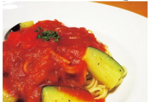
ナスとベーコンのパスタ 750円 自家製トマトソースが美味しい王道のパスタ。+200円でドリンクが、さらに+100円でサラダ、トーストが付くスペシャル満腹セットも好評。

曾根駅前1分、中庭を眺めながらお食事・休憩ができる同店。昔ながらの喫茶ならではの、朝から夜遅くまで多くの世代に愛されている。パスタ、ドリア、サンドイッチなど背伸びしないメニューが並ぶ中、毎日通える飽きない味にリピーターが多い。定期的にジャズやフォークなどのライブを行っているのでぜひ覗いてみては。