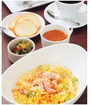
島根のベジタブル米粉パスタのカルボナーラ 1,200円 米粉パスタ、おぼんざい1種、スープ、バゲット、ドリンクがセット

島根県の食材にこだわった多彩な料理が人気のお店。パスタランチには、島根県産米「きぬむすめ」100%の米粉に、にんじんやトマトなどの野菜を練り込んだ米粉麺を使用。コクのあるソースをからめて、もちもちとした食感を楽しんで。