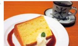
カフェメニューで不動の1番人気のシフォンケーキ。お手頃価格が嬉しい。

特典 「シティライフを見た」でパスタセットご注文の方 ▶デザートアイスcreamをサービス (6月末まで)