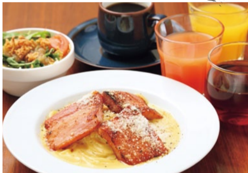
びっくりベーコンのパスタランチ 1,150円 びっくりベーコンのパスタ/淡路島産玉ねぎドレッシングのサラダ/ ドリンクお替り自由/特典のミニワッフル

打ちたて・できたて、コシ&風味が格別の生パスタに、贅沢な厚切りベーコンをトッピングした名物メニューをランチでぜひ。カルボナーラソースとの絡みも抜群!お替り自由の美味しい珈琲・ドリンクでママ友とくつろいで。