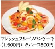
フレッシュフルーツパンケーキ (1,500円) ※ハーフ800円