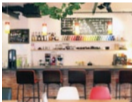
おしゃれな店内、キッズスペース も有り

特典 ランチ注文時に「シティライフを見た」で ▶特製ミニワッフル又は カフェモカorマキアートをサービス (7月末まで、他サービス併用不可 注文時に提示のみ有効)