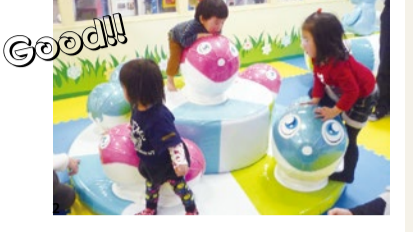
1Fのこども劇場で「ビッグバン遊園地」を開催。ふわふわのすべり台など多くの遊具で楽しめる。この機会にぜひ訪れてみて。

入館料 ●大人 1,000円 ●幼児(3歳以上) 600円 ●小中学生 800円 ●3歳未満 無料 特典 この記事持参で入館料が 20%OFF に ※1枚で5名様まで、6/28~8/31まで 他割引と併用不可、コピー不可、画面提示不可 (E)