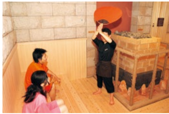
熱波戦線によるローリユースサービスも実施中。

入館料 ●入館料 大人(中学生以上)...750円 小人(5才~小学生)...370円 幼児(3才~4才)...100円 ●爽健美汗(岩盤浴) 大人(中学生以上)...750円 小人(3才~小学生)...370円 ※3才未満のお子様のご利用は不可 特典 この記事持参で ①入館料750円→ 550円に! ②岩盤浴750円→ 550円に! (時間無制限、専用着&敷きタオル付き) ※コピー不可、1枚で5人まで利用可 ※他サービス券との併用不可 ※岩盤浴のみのご利用は不可 (2016年7月末まで)