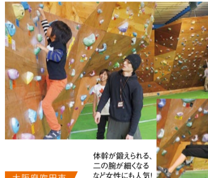
一見難しそうに見えるが実は、ハンゴを登る体力さえあればOK!

クラフト度: ★★★★★ ワクワク度: ★★★★★ 飲食店と並んでいる塩化ビニール素材を使用。本物にこだわった職人さながらの体験ができる。