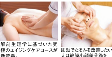
解剖生理学に基づいた究極のエイジングケアコースが即効でたるみを改善したい人は筋膜小顔美骨術を新登場。

素肌のクリニック ESCOS (エスコス) 10時半~21時(店舗・曜日により異なる) 完全予約制 http://www.escos.co.jp