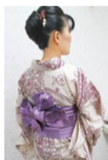
毎年人気、和装プロによる浴衣着付け&ヘアアップは早めの予約を!

髪がポロポロな人にこそぜひ試してほしいのがコレ!普通の矯正ではありえなかった技術で、まさに非常識なストレート。しかも同店は2挺流アイロン技法の認定店で仕上がりが早く綺麗!艶が出て若く見えるのにお手入れが楽と一石二鳥!