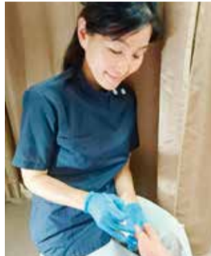
▲肩こり・腰痛の原因にもなる外反母趾。「足」の整体院独自のリハビリプログラムと手技施術で再発しにくいキレイな足へ! O脚矯正など、健康だけでなく女性のキレイもサポート。

「巻き爪」をしっかり治すには、専門的な知識と技術が必要。自分で対処できないレベルになると歩くのも難しくなってしまうので、早めの改善を。「足」の整体院では、「1回目の施術から痛みが無くなった」と好評。矯正用の器具は透明で目立ちにくいものなので、足の露出が増える夏もおしゃれを楽しめる!また、外反母趾矯正では、その人のクセや生活習慣を診てからリハビリプログラムを組み、再発しないよう根本から改善してくれる。まずは、気軽に相談を!