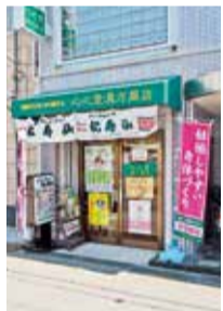
▲JR千里丘駅から徒歩5分とアクセス良好。