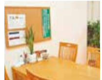
▲どんなお悩みも気さくに聞いてくれるので、何でも相談してみよう。

【千里丘】松寿仙・ホノミ漢方正規取扱店 心心堂漢方薬店 摂津市千里丘2-2-16 営/平日9時半~18時半 土9時半~14時 日祝定休 ※時間外相談も可 ☎06-6338-6509 http://www.shinshindokanpo.com