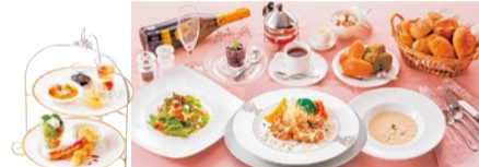
「おしゃべりランチコース」全6品 1,290円～(税別)

ガスパチョール帆立の冷製スープ・前菜2品・メイン(3種より選択)・デザート(2種より選択)・パン(食べ放題)またはライス・飲み物