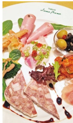
前菜の盛り合わせ 756円～

マグレ鴨やサーモンの自家製スモーク、野菜のバーニャ・カウダ、フリッタータ、プロシュートなど、5～7種のその日のおまかせが味わえるのでファンも多い。 ※写真は2人前