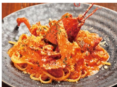
オマール海老のトマトクリーム 2,030円

オマール海老を贅沢に使用した人気の逸品。うま味を濃厚なまま閉じ込めたトマトクリームソースが、もちもちの生パスタにたっぷりからむ!