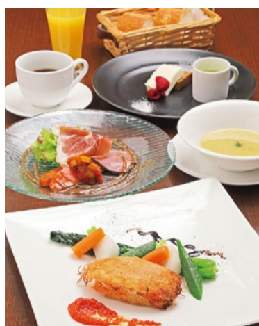
ランチMENU A 1,800円

「シティライフを見た」でランチコース注文の方、デザート1品サービス! (7月末まで)