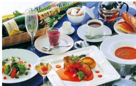
「季節のコース 夏」全7品 2,500円～(税別)

「シティライフを見た」で ●Aランチ注文で「食後のお飲み物をサービス!」 ●Bランチ注文で「メインディッシュを「ブラックアンガス牛」「ミスジ」の「カツレツ ピッツァ・イオー」にに変更(要予約)」 ディナータイム ●イチオシメニュー「トリッパのトマト煮込み」 680円→500円 ●「イカ墨のバスターソット」 1,350円→1,000円 (特典利用は各1皿のみ。予約がおすすめ) (7月末まで)