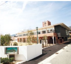
御影の閑静な住宅街にある同園は、真新しい大きな園舎と天然芝の広々とした園庭、子どもたちがのびのび過ごせるのも魅力。

開園から3年目を迎える同園は、特色ある3つのプログラムにより、注目度UPのこども園。最大の特徴である「英語イマージョンプログラム」では、英語を学ぶのではなく、英語で遊んだり、さまざまなことを体験していく中で、英語をツールとして使いこなせる「真の国際人」を育てる。「MIKプログラム」の中では、日本人としてのアイデンティティを育てるためのさまざまな活動も展開。園長先生の「当園では、詰め込み式の教育ではなく、遊びや生活を通じて様々なことを学びます」との言葉が印象的。保護者の就労の有無に関係なく通えることも大きな魅力の一つ。7月から開催される入園説明会へ是非参加してみてください。