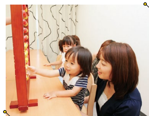
親子でレッスンに参加できるので、子どもと一緒に成長できるとママたちに好評。専門家による保護者へのフォロー体制もあるので安心。

全国で63教室を展開している幼児教室コペル。学ぶことの楽しさを伝えながら、子どもの潜在能力を引き出すレッスンが人気。2,000種類を超えるオリジナル教材やプロの講師によるテンポの良いレッスンなど、子どもを飽かさせない内容になっている。「文字や数、図形に興味を持つようになった!」「集中して何でも取り組むようになった!」など子どもの意外な一面に気づく親も多いとか。今なら体験が無料。親子で一緒に体験会に行ってみよう!