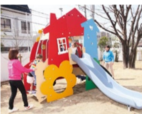
園内の遊具には北欧遊具ブランド「ボ-ネルド」を採用。