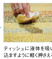
ティッシュに液体を吸い込ますように軽く押さえるだけで、ほとんどキレイに吸い取れた!