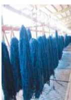
羊を育て、毛を刈り紡ぐ