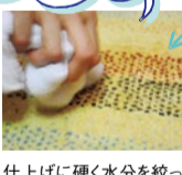
仕上げに硬く水分を絞った雑巾で軽く叩くようにふけば元通りに!