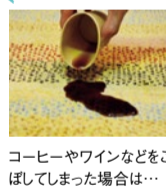
コーヒーやワインなどをこぼしてしまった場合は…