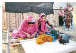
何万回も織り返して織り上げる

ココに惚れた! 『100%天然素材で永く使える』 羊毛を紡いで作った糸を茜の根や藍など草木で染め、人の手で織り上げていきます。化学繊維などは一切なしの100%天然素材。そして、もともとは地面に直接敷いて使うものだったので、とても頑丈なつくり。現地では100年以上使ったオールドギャッベも多くあるようです。