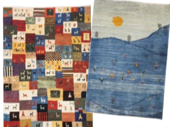
デザインは様々。お気に入りの一枚を見つけよう。

1枚の絵画のように美しく、私たちの心に訴えかけてくる、そんな高いデザイン性。二つひとつが手づくりなので、同じ物は2つとない