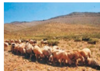
植物でできた染料で染める