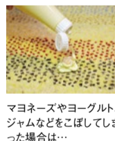
マヨネーズやヨーグルト、ジャムなどをこぼしてしまった場合は…

ココに惚れた! 『お手入れ簡単』 ランリンが豊富な羊毛は手触りだけでなく、汚れにも強いんです。飲み物がこぼれても中まで入っていかさつと拭くだけでキレイに。織りが細かいので、小さなゴミや砂なども中まで入っていかず掃除機でサッと吸い込めます。