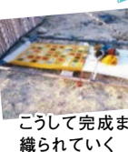
こうして完成まで織られていく