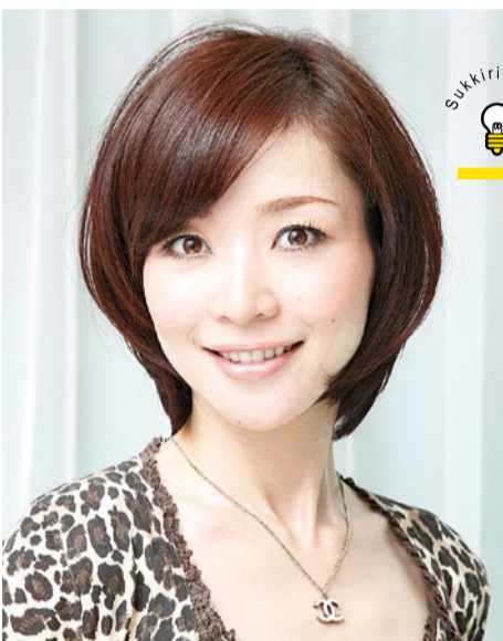
▲定評のある美フォルムカット。優れた技術で悩みをカバー。