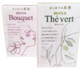
はじめてのお灸moxa 50個入り/各種972円

夏こそ空調による冷えが天敵。頭痛、腹痛、めまいなど、不調の原因となる冷え症。ツボを刺激することで、血液循環を促進し身体を温め。湧泉などは足の冷えに効果的。