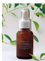
Water Veil(UVケア) 30ml/6,480円

博士号も取得した開発者が手掛ける「Jラインシリーズ」。シリーズの中でもこの時期オススメなのはこのUVケア。寝前の美容液としても使えるほど肌に優しく作られているから毎日安心して使用できる。