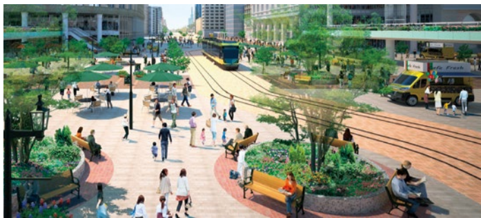
将来イメージ 人と公共交通優先の空間「三宮クロススクエア」のイメージ。三宮交差点は現在車中心の道路空間だが、人のための空間を大幅に拡大。

平成7年1月17日、突如起こった阪神・淡路大震災。今まで誰もが経験したことのない困難な状況の中で、「一人ひとりが困っている人に手を差し伸べ、街の復興のために力を尽くした。」