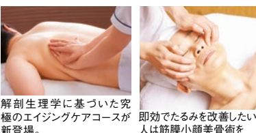
解剖生理学に基づいた究極のエイジングケアコースが新登場。即効でたるみを改善したい人は筋膜小顔美骨術を!

素肌のクリニック ESCOS (エスコス) 10時半~21時(店舗・曜日により異なる) 完全予約制 http://www.escos.co.jp 江坂店 ☎06-6369-1880 御堂筋江坂駅 ⑥出口すぐ 第2ビル6F 豊中店 ☎06-6858-5511 阪急豊中駅前南出口 徒歩1分 チェリオビル4F 梅田本店 ☎06-6316-1500 HEPナビオ前のビル 大阪市北区小松原町3-3 OSビル14F