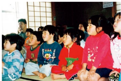
お話会に訪れる子ども