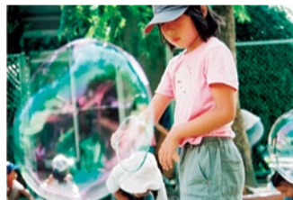
手作りシャボン玉