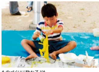
ものづくりに励む子ども

豊中の子ども文庫の歴史を見ると、その規模や広がりには大阪でも群を抜いているが、北摂各地の同様の運動をたどっていくと明治末の「大阪お伽倶楽部」や大正末の箕面村の「教育中心主義」にたどりつく。この倶楽部は明治40年に大阪日報記者であった高尾亮雄などによって設立された。箕面有馬電気軌道(現、阪急電鉄)の箕面駅近くのカフェパウリスがであった洋館に事務所を構えた時期も