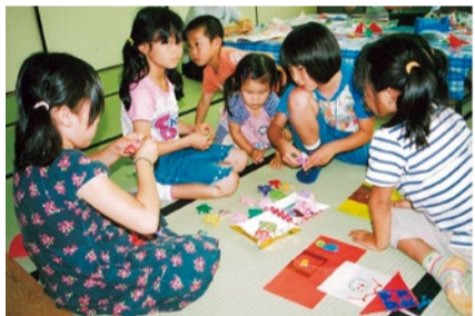
子ども文庫で折り紙で遊ぶ子どもたち

た。そんな中、1960年代末から全国各地で、子どものための文庫活動が自然発生的に生まれ、広がっていった。主役はお母さんたちだった。