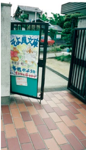
そよ風文庫の入り口