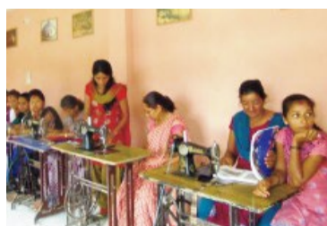
(左)TIFAの活動の1コマ (右)TIFAが行ったナールドタウンの女性支援活動でのミニ教室