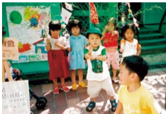
子ども文庫での七夕まつり