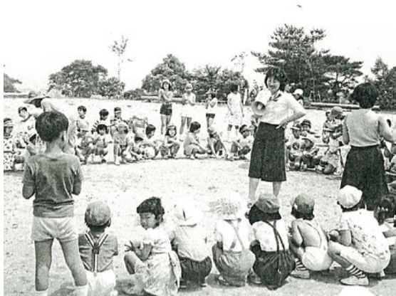
子ども文庫発足当初の様子

戦後日本の学校教育は、敗戦直後の経済復興から昭和30年代に始まる高度経済成長という経済の動き、国による教育管理の強化や「60年安保」に代表される政治的な動きのなかで、木の葉のように揺れ続けた。