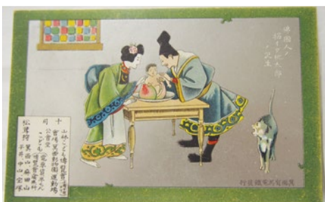
山林こども博覧会の宣伝用チラシ