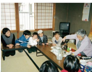
子ども文庫で科学遊びをした際の実験中