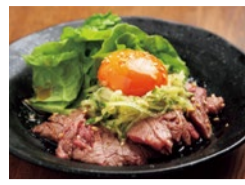
和牛レアステーキ 1,250円

隠れ家焼肉店で希少部位の贅沢な盛合せを味わう 和食歴16年の腕利き店主が肉質を見極め、厳選した宮崎牛や熊本牛など、その時々旬の和牛を提供。本物の高級肉がもつ豪快なうまみと繊細な後味、その両方がじっくりと味わえる。シックで落ち着いた雰囲気のお店は隠れ家風で、家族連れや女子会、ひとり利用も多数。シメは絶品の牛すじカレーをぜひ! 予約がおすすめ!