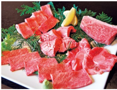
迷ったらコレ! たっぷり400g 6,000円

サーロイン、イチボ、ヒウチ、ザブト、ミスジなど入荷したその日の最高の状態を見てマスターがおススメするお肉がお得!