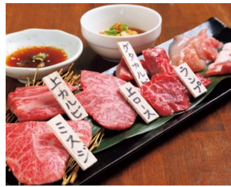
シティライフ限定 厳選和牛5種盛り&鶏豚盛合せ 2,500円

店主が目利きして仕入れたA4ランク以上の本日おススメの黒毛和牛5種に、鶏(宮崎産)豚(山形産)をセットした贅沢な盛合せ。