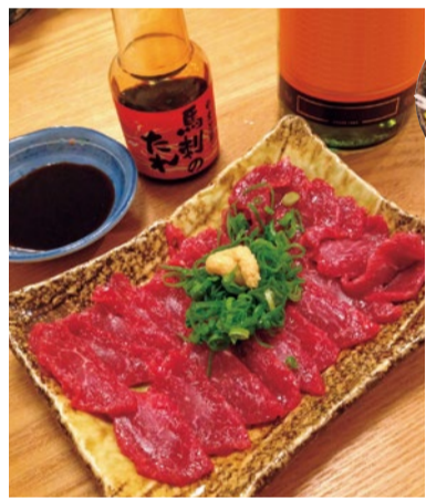
特選赤身 100g 1,382円

国内流通の馬刺しでも珍しい青森産(国産)馬肉の特選赤身は一番のおすすめ。肥育方法や冷凍方法にこだわったお肉は、濃厚な肉の旨みが絶品。