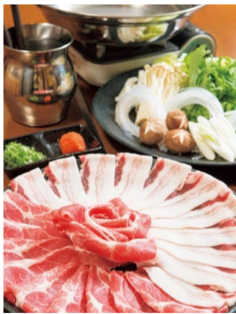
鹿児島黒豚のしゃぶしゃぶ (バラ、ロース) 1人前1,680円

「シティライフを見た」で 厳選和牛5種盛り&鶏豚盛合せを2,500円で提供 (8月末まで)