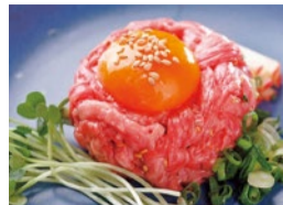
リピート率の高い黒毛和牛ユッケ。常連さんも「とりあえずユッケ」と言うほど。特典で今だけは1,280円が半額に!

特典 「シティライフ見た」で、下記メニュー半額 黒毛和牛ユッケ 1,280円→ 640円 炙り特上ロース 1,480円→ 740円 アボガドサラダ 780円→ 390円 厚切り上タン 1,480円→ 740円 イチボ 1,780円→ 890円 サーロイン 1,980円→ 990円 エクストラコールド 680円→ 340円 (7月末まで・1人1品まで)