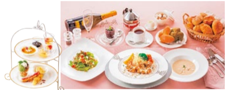
「おしゃべりランチコース」全6品 1,290円~(税別)

ガスパチヨor帆立の冷製スープ・前菜2品・メイン(3種より選択)・デザート(2種より選択)・パン(食べ放題)またはライス・飲み物