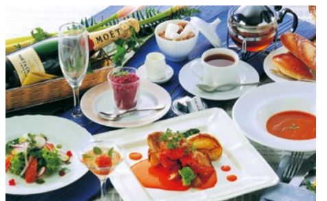
「季節のコース 夏」全7品 2,500円~(税別)

ガスパチヨor帆立の冷製スープ・前菜2品・メイン(3種より選択)・デザート(2種より選択)・パン(食べ放題)またはライス・飲み物