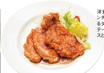
洋食屋のしょうが焼きランチ(800円)は品のあたるタレが絡み、まるでステーキのよう。同じくライスとみそ汁がセットに。

「おいしいものをリーズナブルにと話すシェフのとおり、昔ながらの背伸びをしない正統派の洋食屋。ハンバーグステーキやビーフカレー、チキンカツなど王道メニューが本格的に楽しめる。地元でも評判。ランチの食後はプラス200円のサイフォンコーヒーも。夜はワインも良く似合う店内。抜群のコスに優れた同店へぜひ。