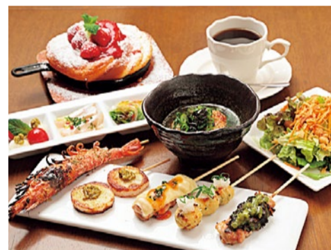
炭焼き変わり串コース 1,620円

(サンタカフェ・ハッシュ) 摂津市千里丘東3-10-10 ブラウンシュガービル 1F 営/11時~16時(L015時半)、18時~23時(L022時半) ※日曜はランチのみ 木曜定休 ☎072-625-2662 http://hash199853.blog47.fc2.com/