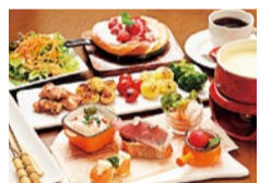
炭火で焼いた野菜やお肉を、白ワインとゴルゴンゾーラ入りの特製チーズにからめていただくコース。 ※写真は2人前

「炭焼き変わり串コース」は、前菜の盛り合わせ、サラダ、炭焼き串5種など、その日仕入れた新鮮な食材を使った料理の数々が並ぶ、彩り鮮やかなランチコース。お昼から串焼きとワインでプチ贅沢なランチを!(予約限定)