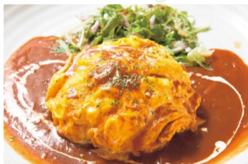
オムライスセット(ドリンク付) 900円

ふわふわの卵とコクのあるデミグラスソースが絶妙のハーモニー。ソースは選べ、懐かしいマトクリームも捨て難い。リピート必須のオムライスをぜひ!