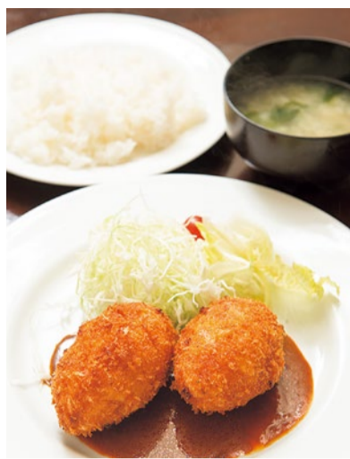
クリームコロッケランチ 800円

ずっしりした俵型コロッケをさくと割ると、中にはとろける味わいのクリームが。女性からの支持も高く王道メニューに負けない人気ぶりだ。夜は単品350円(1個)で提供。ランチはサラダ、ライス、みそ汁がセット。