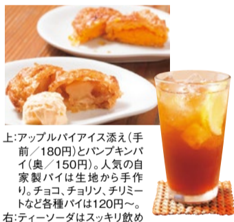
上:アップルパイアイス(手前/180円)とパンブキンパイ(奥/150円)。人気の自家製パイは生地から手作り。チョコ、チョコリソ、チリミートなど各種パイは120円~。右:ティーソーダはスッキリ飲めてこの時期ピッタリ!セットでの注文も可。