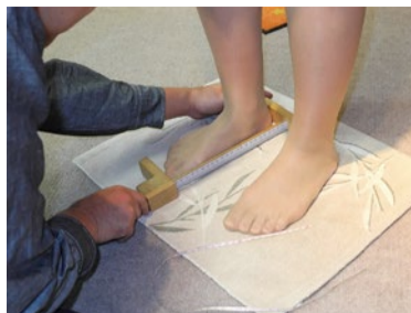
「正しい靴選びは、足のサイズと特徴を正確に知ることから」と大持さん。計測だけでも気分よくしてくれるのはうれしい。

「シティライフを見た」で ●初診料2,000円が 無料に! (8月末まで) ※要予約