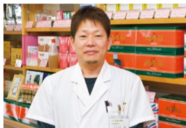
難しい専門用語は使わず、分かりやすく説明してくれるので安心。

特典「シティライフを見た」で先着10名限定 (9/16まで) ●一番人気メニュー「コリとり+体質改善整体」 (初検料3,000円+施術料5,000円)通常8,000円→2,480円 さらに、痛くない小顔矯正体験つき!