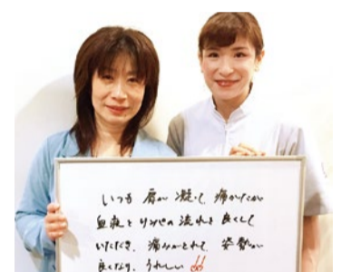
女性整体師だから安心して、先生の優しい口調と丁寧なセルフケアのアドバイスも好評。