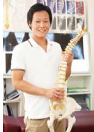
肩こり・頭痛・腰痛はもちろん交通事故のむち打ち等、どこへ行ってもよくならない辛い痛みこそ気軽に相談を。

肩こり・首の痛み・頭痛に特化した、背骨・骨盤矯正の専門院。全国でも数少ないレントゲン分析を元にした骨格矯正を行って、雑誌でも度々取り上げられるほど施術力の高さが評判。最新の設備と最先端の矯正を試してみてください。