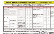
大阪府のホームページには、自転車保険に加入しているかチェックできるシートが掲載されているので参考に。