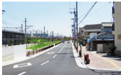
以前は一車線だった狭い道が、写真のように歩車分離の安全で快適な道へと生まれ変わった。