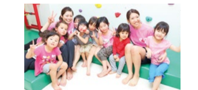
キッズトレーニング資格取得のプロパーソナルトレーナーによる発達発達専門指導だから安心。子どもたちを夢中にさせるボルダリング、スラックラインなどのアイテムも多数。子どもの成長や発達に不安を持つママも気軽に相談を。