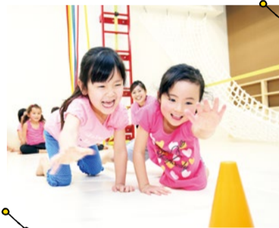
約80%の神経が形成される3~8歳の「プレ・ゴールデンエイジ期」。将来に大きく影響し、運動能力の基礎も養われる。専門的能力が最も身につく9~12歳の「ゴールデンエイジ期」を無駄にしないためにも、この時期にしっかり神経回路を開いておきたいもの。