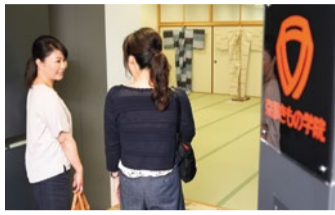
関西エリアだけでも80ヶ所の教室数。駅チカで通いやすいのも嬉しい!

特典 「シティライフを見た」で9/10(土)までに入学された方 入学金+授業料 (全10回・約3ヵ月間) 20,000円→10,000円