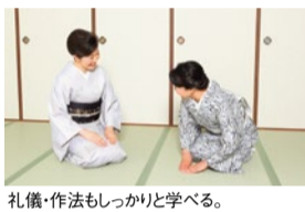
礼儀・作法もしっかりと学べる。