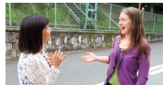
ここ数年増えている外国人観光客。街で話しかけられたという生徒さんの多くが、「道を尋ねられても、うろたえずに落ち着いて英語で教えてあげられた」と喜ぶ。

「英語を話せるようになりたい!」そんな願いに応えてくれる同スクール。Englishがモットーで、レッスンはいつも笑い声が絶えないほどアットホームなのが幅広い世代に支持される理由だ。お互いに間違い合い、笑い合う雰囲気だから、「完璧でなくて