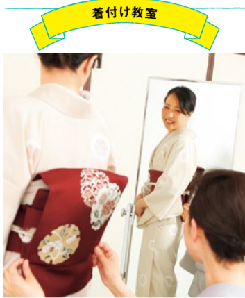
きめ細やかで丁寧な指導のもと、しっかりと技術を習得できる