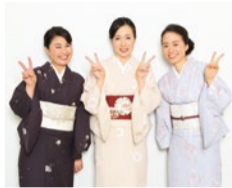
9月生入学の方にはもちろん、立上りの着物がプレゼント!

そんな同学院では9月生の募集にあたり、無料の教室見学会が開催される(左記囲み参照)。「実際、どんな授業内容なの?」「興味はあるけど、教室の雰囲気は気になる:」という方は、是非無料見学会に参加してみよう!