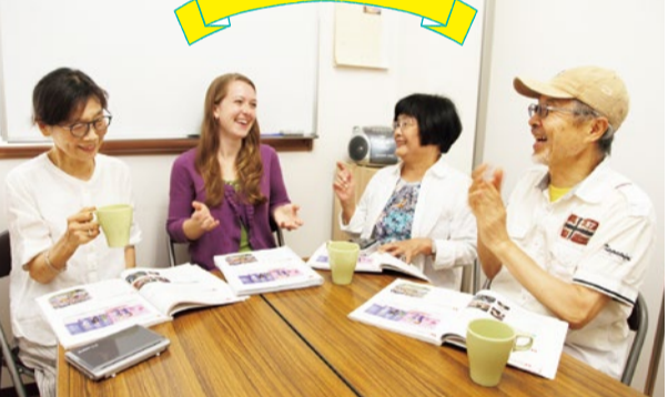
「すぐ打ち解けられた」との声が多い和気あいあいのレッスンは、まずフリートークからスタート。近況など身近な話題なので、気軽に英語を話せる。毎回テキストから、役立つ表現も学べる。90分レッスンなのに料金は50分並と良心的!