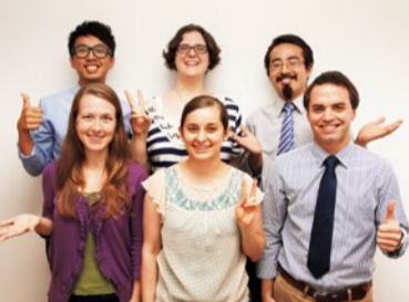
講師陣は、アメリカの教会から推薦を受けた確かな人のみ。気さくで話しやすく、熱心な指導で生徒の信頼も厚い。