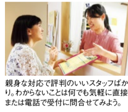
親身な対応で評判のいいスタッフばかり。わからないことは何でも気軽に直接または電話で受付に問合せしてみよう。