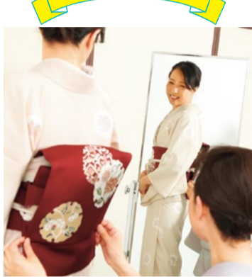
きめ細やかで丁寧な指導のもと、 しっかりと技術を習得できる