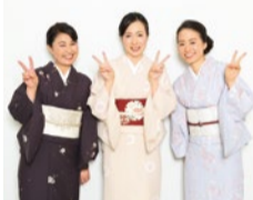
9月生入学の方にはもちろん立上り着物の着付けがプレゼント!

また、将来的には資格取得を目指したい、身につけた技術を仕事として活かしたいという方には、充実したカリキュラムや卒業後の就業サポートで活躍の場が用意されている。細かなところまで丁寧かつ、楽しく教えてくれるので技術の吸収が早く、より実践的な為、満足度の高いお稽古が続けられるという。