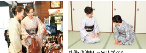
礼儀・作法もしっかりと学べる。

宝塚・伊丹昆陽・千里中央・江坂・京都駅前・三ノ宮など 各教室でも開催中 ※日程・詳細はお問合せを