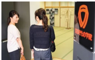
関西エリアだけでも80ヶ所の教室数。 駅チカで通いやすいのも嬉しい!