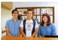
「髪のごことは私たちに任せ下さい」