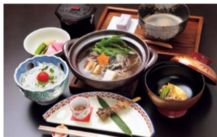
すっぽん鍋ランチコース(2,750円) サラダ/珍味/椀物/すっぽん鍋/ご飯/香の物/コーヒー/和菓子