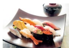
雅(みやび)…1,380円 お寿司10貫に玉子焼、汁ものがついたちょっと贅沢グルメ。本格寿司を気軽に味わえる。

のど黒を味わう特上ランチ 加賀百万石を丸ごと堪能 金沢の漁港から日本の豊かな海の幸を仕入れ、そのネタの良さが魅力の寿司店が関西初のOPEN。従来の寿司店と一線を画す同店では、店内の装飾や金文や半個室席など、ミラーにもピッタリ。沢・丸谷焼の器を使用するなど加賀百万石の食を堪能できると話題に。高級魚や希少なネタも同店ならではの注文。タッチパネルでの注文や半個室席など、フ