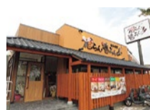
半セルフサービスなので、気兼ねなくゆつたりできる。ギフト商品も豊富にあり、お土産にぴったりの和のお菓子も揃っている。