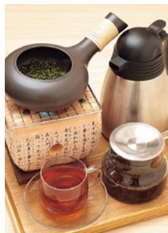
ほうろくたて ほうじ茶 500円(税別)

モノレール少路駅近くのロマンチック街道沿いにオープンした「和み茶寮 花らん香ろん」は、大人の女性にゆつたりと寛いでもらえる空間をめざした和カフェ。「時間を気にせず、こだわりの和メニューを味わいながら、ゆつくりとお喋りを楽しんでもらえれば」と話すのはマネージャーの八田さん。その言葉どおりブレンド珈琲や紅茶、緑茶はホット、アイス共にポットで提供される。また、ランチにぴった