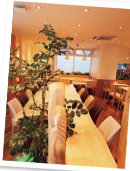
←彩りチョコ抹茶フォンデュ(1,280円)はお菓子や果物、野菜チップスを溶かしたチョコにくぐらせて。