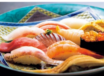
舞紋(まいもん)…1,980円 のど黒、本まぐろ中とろ、ばい貝、生甘えびなど日替わりの特選ネタが入った特上握り。プレミアムな極上ネタに感動の連続。