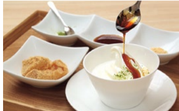
甘味メニューでいちばん人気の「森の味わいソフトセット わらび餅添え(460円)」。「黒蜜やきなこ、抹茶で好みのアレンジが楽しめる。わらび餅をのせてもgood!