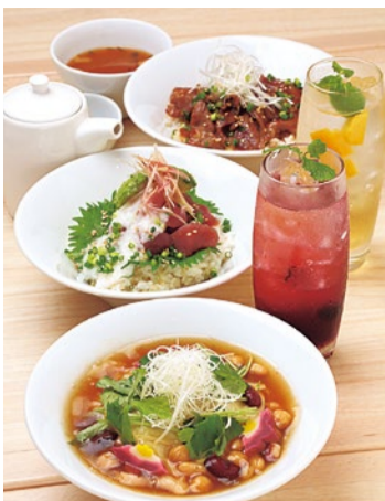
手前から「京湯葉の船かけ丼(840円)」、「天然マグロとアボカド丼(880円)」、「十勝絶品秘伝のタレ豚丼(880円)」。果肉入りピネガソーダ(各650円)も美味。

人気の甘味は「柔らかい餅のぜんざい」、「飛騨水のわらび餅」、「味わい串団子」の他、夏にうれしいかき氷もラインナップ。めずらしいところでは「彩りチョコ抹茶フォンデュ」。2人でシェアして楽しむのもおすすめです。最後にホットミルクで溶かすと2種類の