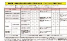
大阪府のホームページには、自転車保険に加入しているかチェックできるシートが掲載されているので参考に。

見るべきポイントは、 ①個人賠償保障は1億円以上あるか ②示談交渉サービスが付いているか ③自分のケガの補償（傷害保険）がついているか ④同居の家族全員が対象か、など。併せて、日ごろから自転車の安全運転を心がけたい。