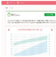
成長曲線や予防接種の記録も表示されるので、いつでもどこでも確認できる。

電子サービス「e-Ikeda_s」は、A4版の紙媒体「いけだつながらシート Ikeda_s」の一部を電子化したもの。同シートはもともと、市民と行政が一体となり、年齢や障害の有無を問わず、誰もが共通して使える成長や発達の記録を活用することを目指し、大阪大学に研究委託して2012年に作成され、全市民を対象にして希望者に配布されている。その後2015年にソフトバンクが社会貢献の一環として電子化に協力。さらに電子母子手帳のシステム開発を行う企業も加わり、「e-Ikeda_s」が完成した。今後は、利用者の声を参考にしなが