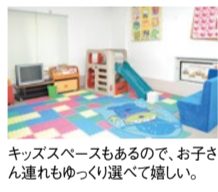
キッズスペースもあるので、お子さん連れもゆっくり選んで嬉しい。

1年で最も安く学習机が手に入るシーズン到来! 同店はこの時期、各メーカーから2016年モデルの最終処分品が続々入荷している。大きなモデルチェンジのないデスクなら新型と大きな変わりはなく古さは感じない。さらに2017年新型も一部店頭で登場!新旧合わせて100台以上揃い、コイズミ・イトーキなどの有名メーカーの過剰在庫や展示品も多数扱う同店で、賢く学習机を手に入れて!