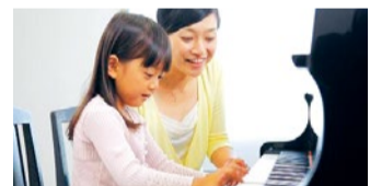
ピアノの楽しさが実感できる「ピアノチャレンジ」コース。

茨木センター 茨木市双葉町8-1 奥村ビル5F 高槻センター 高槻市紺屋町7-9 JR高槻駅前松坂屋南口前 高槻宮之川原教室 高槻市宮之川原5-20-1 サボイ清水店2F 問合わせ:茨木センター/火~土(日・月・祝除く)10~17時 072-635-8866 http://www.kawai.co.jp カワイ音楽教室でも検索可能