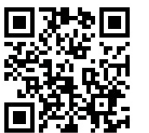
上記からも申し込みできます