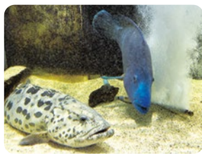
気持ちよさそうナポレオンフィッシュ(右)と「ジャグジー」の順番を待つカスリハタ(左)。

この夏、映画で話題のナンヨウハギは、サンゴや岩の隙間に素早く「かくれんぼ」するよ。