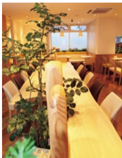
ママ友とおしゃべりタイムを楽しむもよし、カウンター席で一人まったりと和むのもよし。時間を気にせずゆったりと過ごせる。