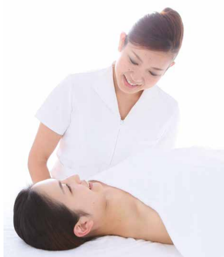
最先端の「若返りトリートメント」に話題沸騰!

「肌再生に導く幹細胞培養液」の「システムセラムトリートメント」の再生を促す、ヒト脂肪由来幹細胞培養液を使用し、トリアームの「システムセラムトリートメント」を塗布して、細胞を生き生きとしたコラーゲンやエラスチンを