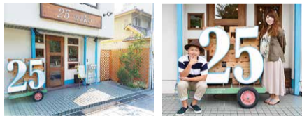
阪急高槻市駅から徒歩5分、閑静な街並みで落ち着く場所にある。オシャレな外観と「25」の看板が目印。