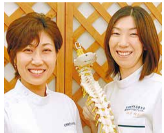
痛みの原因を探り、家庭で出来るケア方法や痛みを予防する体操を教えられる。女性ならではの的確なアドバイスが人気。

骨盤に歪みがある人は肩こり腰痛などの症状が出るだけでなく、代謝が悪くなって体形が崩れやすいそう。同院は手技で骨格の歪みを整えて神経機能の正常化をはかり、体内循環を促す。代謝が上がって痩せやすくなり、免疫力もUP!少しでも気になる人は頼れる先生に相談を。