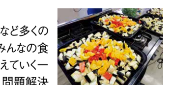
この日のメニューは、なんちゃってパエリア・コールスロー・おみそ汁・グレープフルーツ。

開設に至った後も、ボランティアや寄付金の不足など多くの問題を抱えているこども食堂も多い。取材した「塚口みんなの食卓」も調理ボランティアが不足していて、参加者が増えていく一方、運営側の人手が足りないという深刻な状況。問題解決には地域の協力・理解を早急に深めていくことが必要だ。