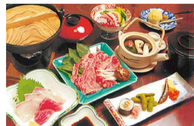
▲茨木神社からすぐなので七五三やお宮参りの帰りにもおすすめ。広間も個室もあるので、用途にあわせてのご利用もOK!