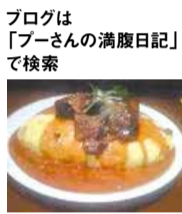
北摂を中心として美味しい店を食べ歩いている人気の有名グルメプロガー。