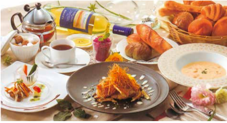
▲「ランチの女王コース」(全6品)1,290円〜(税別)。スープ・前菜3種盛り合わせ・メイン4品より選択・デザート(4品より選択)・焼き立てパン食べ放題(ライス)・飲み物。 ※男性もOK・16時まで・土日も提供