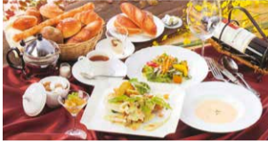
▶「季節のコース」全7品2,500円〜(税別)※時期により内容が変わることもあります。