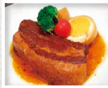
◀ご飯が欲しくなるオススメの一品。旨みを吸った煮卵も美味しい。

今日は、たこ焼き屋さんの「おっきいパパ」に行ってきました。すごく迷った結果、今日はこれをお願いしました。「ぶた〇焼 5個」400円。たこのかわりに角煮が入った、白だしたつぷりのたこ焼きです。マスタードマヨネーズに鰹節をかけて、さらに青ネギののってます。ではでは一口!超ウルトラメチャ旨い!生地はモチモチで出汁の旨みが口の中いっぱい広がります。中の角煮がジューシーで、これはありですね〜。追加でこれをお願いしました。「角煮 並」450円。見た目でも美味しそう。ではでは一口!超ウルトラメチャ旨い!醤油の濃さ、脂の甘み、肉の柔らかさがすごく僕好みで美味しいですね〜。是非食べに行ってくださいね。