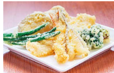
おすすめ定食...890円(えび、豚ロース、ブロックリー、いか、さつまいも、いんげん、めごち)