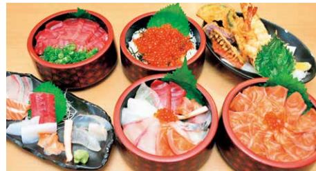
▲左上から時計回りに本まぐろ定食・イクラ定食・本日の天ぷら定食・サーモン定食・本日の海鮮定食・本日のお造り定食。アラ汁、小鉢2点、ご飯がセットで全て1,200円(税別)。