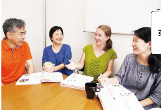
お互いに関わり合い、笑い合う楽しいレッスン。少人数制なので発言の機会も多く、スムーズにレベルアップ。90分レッスンなのに料金は50分並と良心的で、通いやすいのも魅力。

大人になった今だからこそ始めてみるのも楽しいもの。 テニスやダンスに着付けなど様々な習い事を紹介します。 新しい自分に出会えるチャンスです。 P.6まで続く