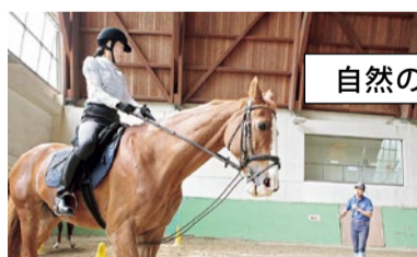
経験豊富なインストラクターが丁寧に指導するので、初心者でもOK!