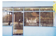
アクタから中津浜線に抜ける道を北へすぐ、青い枠が目印。

普段は意識することのないインナーマッスルを鍛えることで、全身のバランスを整え、健康的で快適に過ごせる身体を手に入れられるピラティス。9月にオープンしたばかりの同店は、マンツーマンのレッスンが受けられる専門スタジオなので、一人ひとりの改善や腰痛・肩こりの改善、姿勢や腰痛・肩こりの改善、姿勢や腰痛・肩こりの改善、姿勢や腰痛・肩こりの改善。