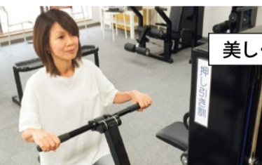
身体の生活動作機能を改善するファンクショナルトレーニングで筋力のバランスを整えていく。

運動不足解消など様々な効果があり、ストレッチ解消&リフレッシュ効果も抜群。まずは気軽に体験レッスンへ!心地よい空気が漂うスタジオで、気持ちのいい身体づくりを始めよう。