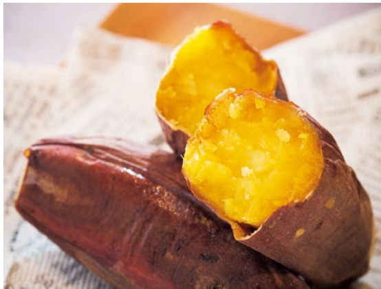
やみつき紅はるかの焼き芋 1パック(2~3本入り) ..... 500円

同店では紅はるかの栽培から熟成まで一貫して行っている。密閉度の高いオーブンで保水調整をしながら焼き上げているので、芋からしたたるほど蜜があふれている