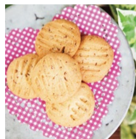
ローストタマネギのクッキー