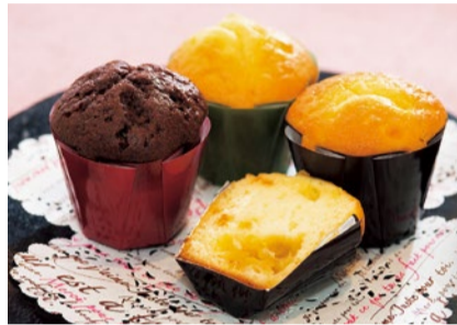
紅はるかのマフィン (左からチョコ、プレーン、オレンジ)