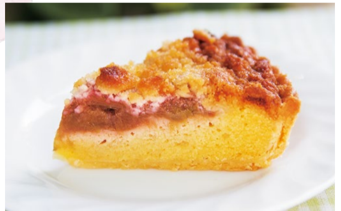
ルバーブのタルト ..... 430円

淡路島産のローストタマネギを使って、甘いのに香ばしいクッキー。バーベキュー風味のようなクセになる味