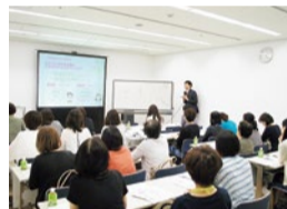
多くの女性に支持され、これまでに1,100名以上が参加しているロングランセミナー。以前の回に参加した人からオススメされて聴きに來る人も多いとか。